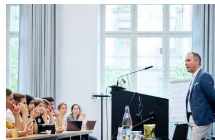
Illustration 2 : Thomas Zurbuchen, directeur scientifique de la NASA, était l'invité spécial de cette première édition.